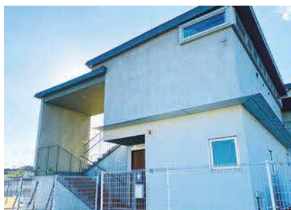
徒歩2分の位置にある企業主導型の保育園