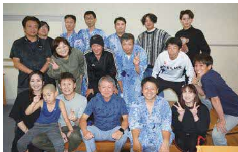
育児中でも参加しやすいよう1泊までの行事は子ども連れOK