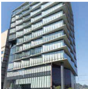
熊本駅近くにオフィスを構え、利便性も抜群