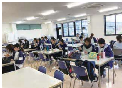
「お互い様」の思いが根付くアットホームな社内