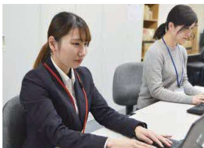
社内のコミュニケーションもよく、何でも相談しやすい環境