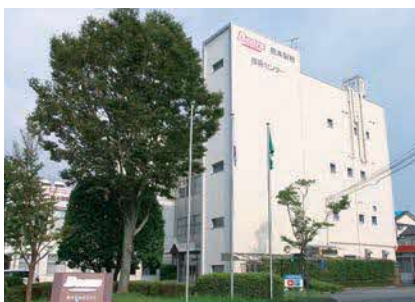
九州の立地を活かし、持続的な成長を目指しています