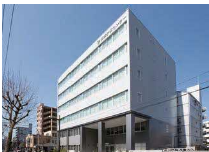
情報処理システムで行政や民間企業を支援