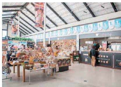
共同で運営している上天草観光拠点施設「ミオカミーノ天草」