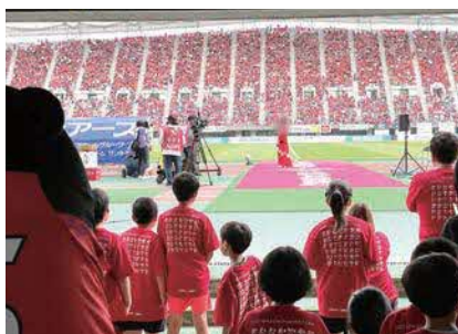
ロアッソ熊本のサンクスマッチに社員の家族も参加