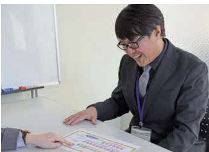
本人、上司、人事・制度担当の4者で復職まで数回面談を実施