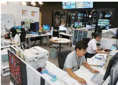
子育てしながらキャリアを積める仕組みを整備していく