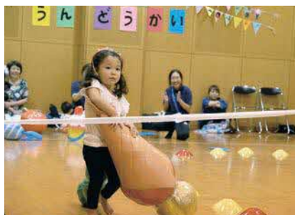
法人内保育園の運動会の様子