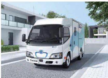
物流を支えるトラック・バスの販売、整備を行う