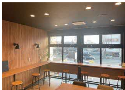
オシャレで快適な職場環境。キッズスペースも完備