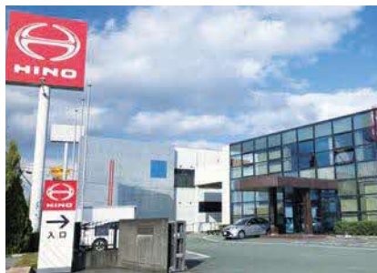
本社周辺の環境整備のため毎週金曜日に清掃を行う