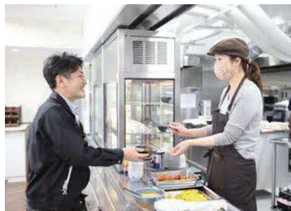
朝・昼ともに栄養たっぷりの食事が摂れる社員食堂