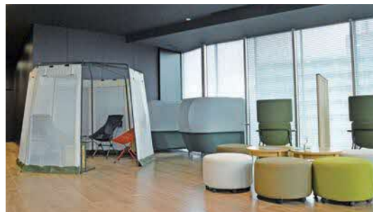
和室やソファなど心地よい休憩室完備で安心