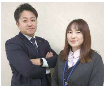
相談窓口の取締役と総務部主任