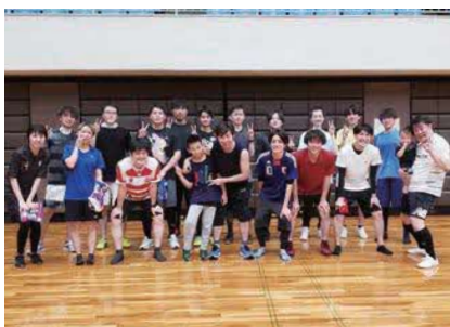
社員の家族も一緒に参加できるレクリエーションも実施