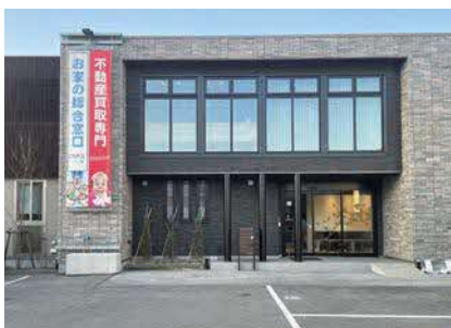
お家の相談窓口の「CRAS」熊本店であり本社社屋