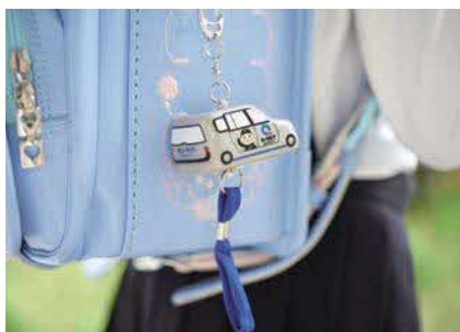
県内の新小学1年生に防犯ブザーを寄贈している