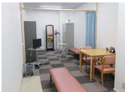
妊娠中に体調が優れないときも休憩室があるので安心