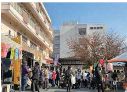
地域密着の施設として、おまつりや講座等を開催