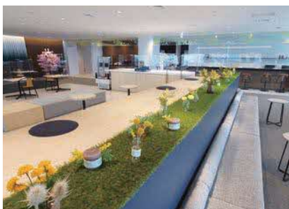
オフィス上階にある談話室。18時以降はお酒もOK