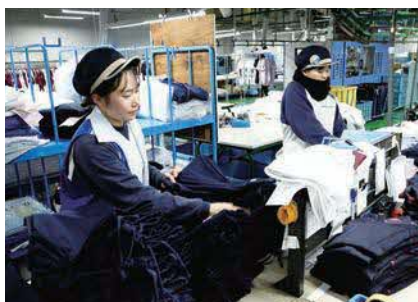
リネンサプライ事業で業界シェアNo.1