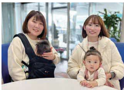
育休中に子どもを連れて会社を訪れる社員も多い