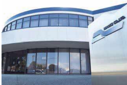
様々な有名チームのユニフォームを手掛ける