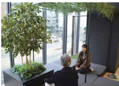
社内には様々なスタイルの休憩スペースが完備