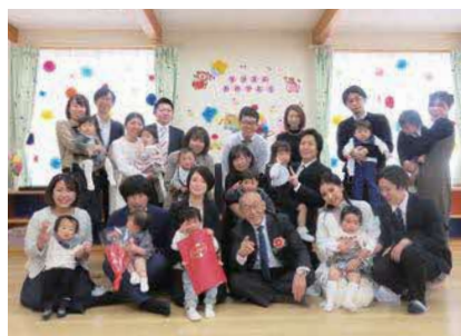
施設内の保育所では28名までのお子さんを預けられます