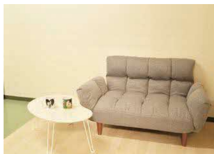
ゆったりソファでくつろげる休憩室を完備