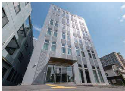
2023年新病棟を増築。病床数は177床