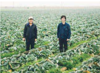
青果物を通して九州の食生活を支えています