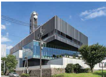
熊本唯一の県民テレビとして「みんな輝く、KKT」を目指す