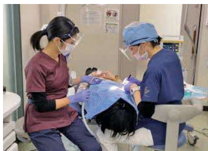
他の歯科医では難しい症例も一手に引き受ける