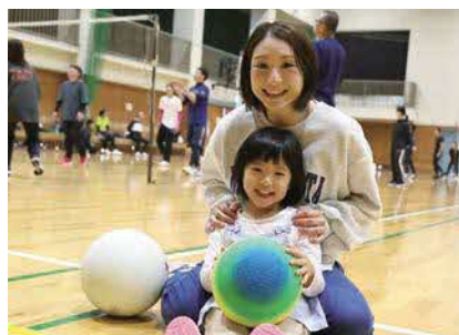
社内レクリエーションでの社員とお子様の様子