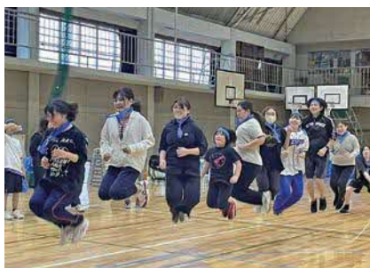
職場主催の運動会で家族間の交流も生まれる